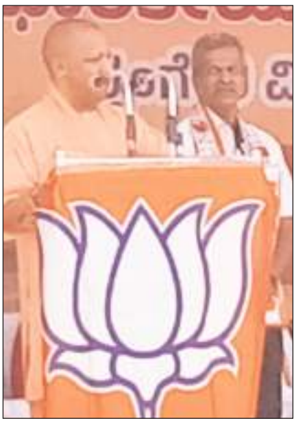
कर्नाटक में सीएम योगी चुनावी रैली को संबोधित करते हुए।